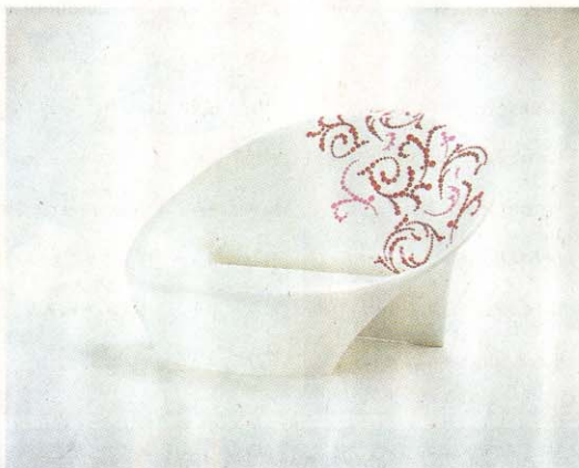
Die Kunststofflampe Medusa und das mit Swarovski-Applikationen verzierte Sitzmöbel „Calla“ werden in Mailand präsentiert.