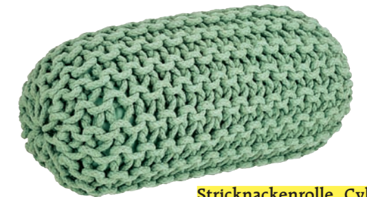
Stricknackenrolle „Cylinder“ ist in verschiedenen Farben erhältlich, ca. 80 € (ferm-living.de)