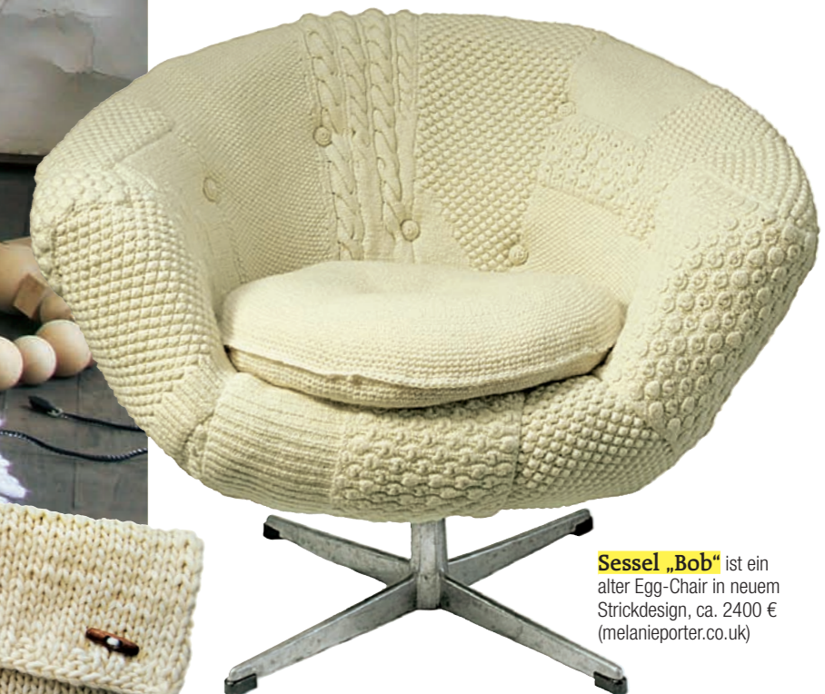
Sessel „Bob“ ist ein alter Egg-Chair in neuem Strickdesign, ca. 2400 € (melanieporter.co.uk)