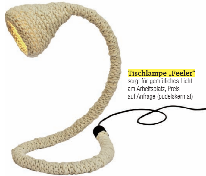
Tischlampe „Feeler“ sorgt für gemütliches Licht am Arbeitsplatz, Preis auf Anfrage (pudelskern.at)