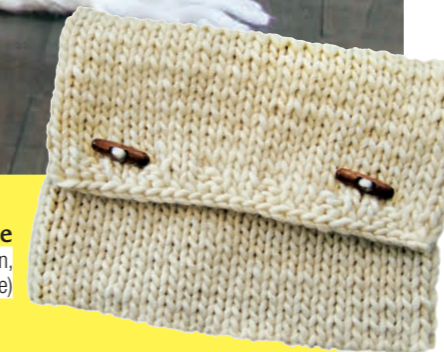
Laptoptasche von Miami schützt vor Kratzern, ca. 60 € (ameeberle.de)