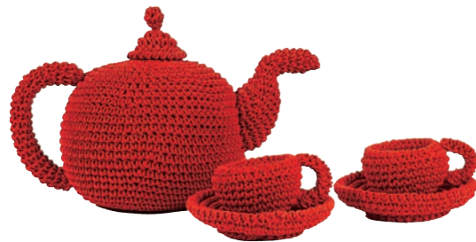
Überdimensionales Tee-Set von Anne Claire Petit – auch in Schwarz –, ca. 170 € (bijzondermooi.nl)