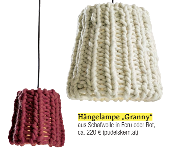
Hängelampe „Granny“ aus Schafwolle in Ecu oder Rot, ca. 220 € (pudelskern.at)