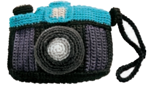
Häkel-Fotoapparat „Helmut N.“ von Donkey Products, ca. 25 € (design-3000.de)