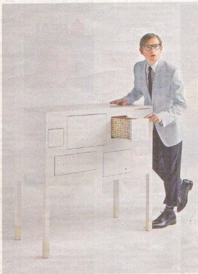
Symbiose aus Funktionalität und Poesie: die Garderobe „Milky Star“ und die Kommode „Mrs. Robinson“ von Pudelskern.